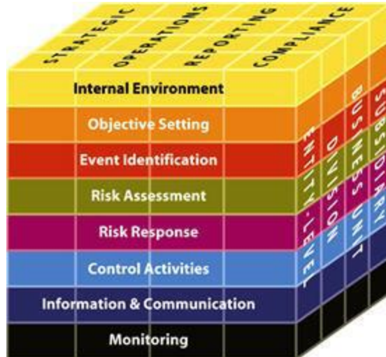
รูปภาพ ๑ องค์ประกอบในการบริหารความเสี่ยงตามมาตรฐาน COSO ERM Integrated Framework

COSO + ERM Risk Management Objectives ๔ วัตถุประสงค์ ๘ องค์ประกอบ ๔ ระดับ Risk Components Entity and Unit-Level